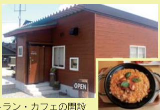
農家レストラン・カフェの開設