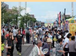
地産地消県民交流フェア