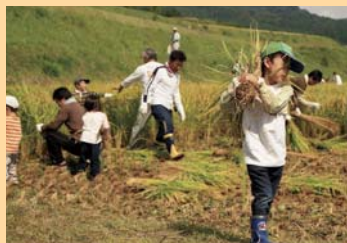
農山村での農作業体験

●農林漁業等体験者数(延べ人数) 49,400 人 (H25) → 54,000 人 (H33)