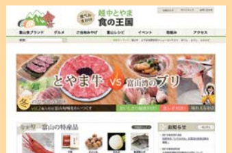
ホームページのトップ画面

●越中とやま食の王国HPへのアクセス件数 20,000 件 / 月平均 (H25) → 41,000 件 / 月平均 (H33)