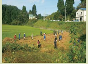
耕作放棄地の復元・除草作業

●中山間地域直接支払 協定締結集落数 395 集落 (H25) → 410 集落 (H33)