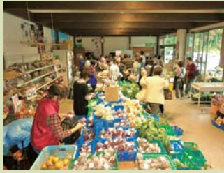
直売所における地産地消の推進

●直売所・インショップ販売額 28.7 億円 (H25) → 32 億円 (H33)