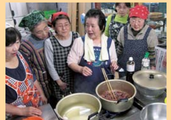
「伝承の匠」による料理実演

「とやま食の匠」とは 特産品の生産や、郷土料理、県産食材を使用した加工食品や創作料理について優れた技術・技能を有する方(団体)を認定しています。