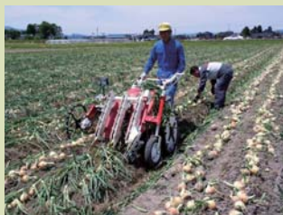
機械による玉ねぎの収穫作業